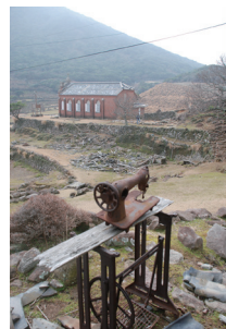
第5回 入選「流と静」若松睦美 (長崎県南松浦郡 撮影 野崎島 旧野首教会堂)

ご旅行代金 | 62,800円(2～4名様に1室) 旅行保険付 (長崎で宿泊不要の方は-20,000円) ※食事 | 朝3回・昼2回・夕3回 ※最少催行人数 20名 (お1人でのお申込みの場合相部屋となります)